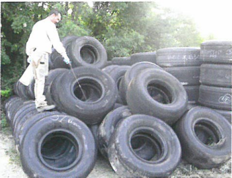
Vider et protéger les pneus