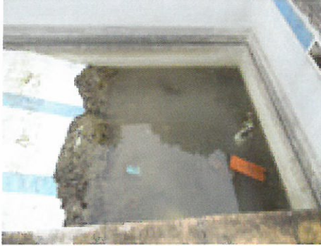
Vider et protéger les bassins

Éliminer l'eau stagnante qui peut servir de gîte larvaire.