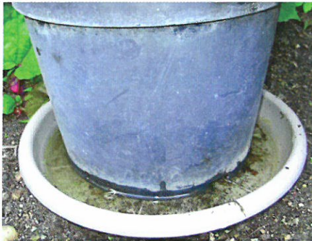
Mettre du sable dans les dessous de pots