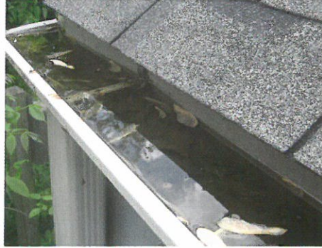
Déboucher les gouttières