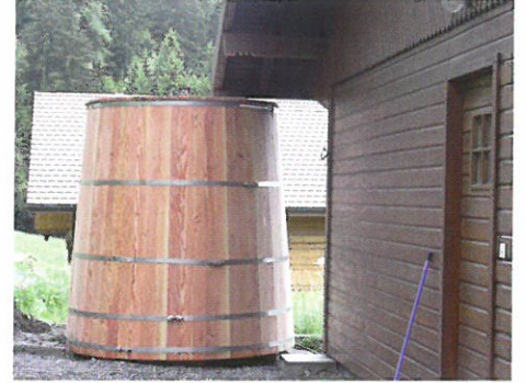
Protéger les récupérateurs d'eau par une moustiquaire