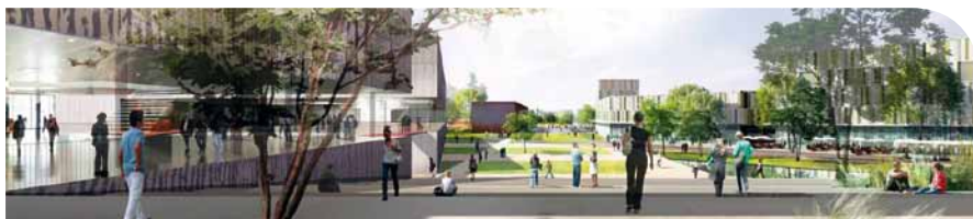
Toulouse Montaudran, Aerospace : la piste, épine dorsale du projet