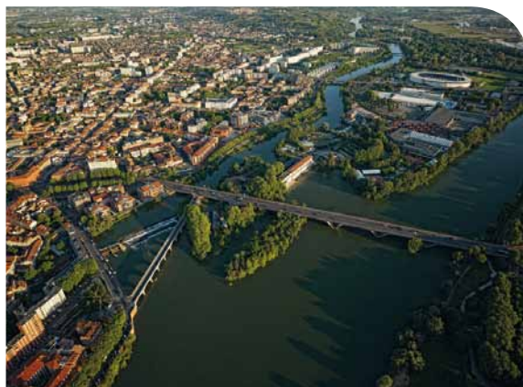
L'île du Ramier

Protéger et valoriser le patrimoine sera un des autres objectifs poursuivis par la Ville de Toulouse : un recensement des typologies architecturales anciennes et traditionnelles sera mené. Les nouvelles constructions qui ne dénatureront pas l'identité toulousaine encourageront l'innovation architecturale et le développement durable. Certaines s'intégreront dans les éco-quartiers (comme ceux en cours de réalisation à la Salade et à la Cartoucherie). Les entrées de la ville seront réaffirmées par la création des éléments de repères qui identifieront instantanément le lieu. Enfin, le partage de l'espace public sera une des priorités : transports collectifs en site propre, modes doux, limitation de la vitesse.