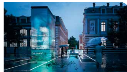
Le Quai des Savoirs

Elle se traduira notamment par l'aménagement des boulevards, formant un octogone vert, et l'harmonie retrouvée entre forme urbaine et végétal qui forme l'identité du centre.