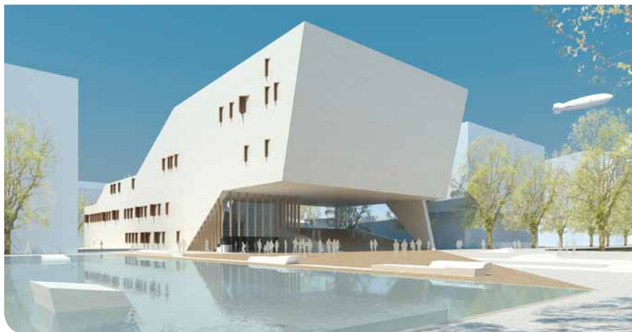
Perspective de la future Maison de l'Image