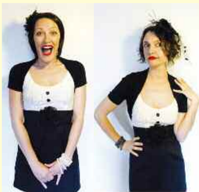
Les 2moiZelles, chansons françaises de 1920 à 1950

Un programme détaillé est à votre disposition dans les points de diffusion habituels : Point Info, accueil Capitole, Mairies annexes, bibliothèques, centres d'animation, etc.