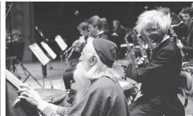
RENCONTRES TRANSMUSICALES DE RENNES - 1988