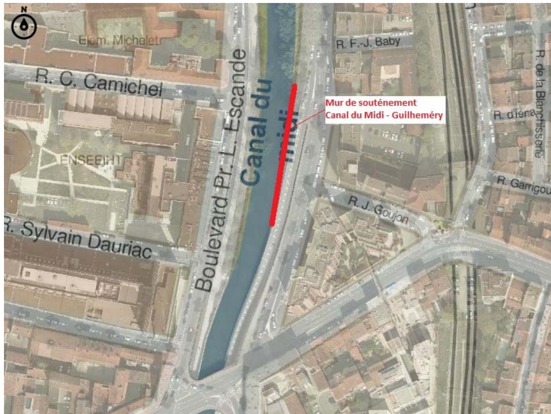
Localisation du site

Des peintures aérosols appropriées seront utilisées. Les matériaux seront en conformité avec les normes de sécurité environnementales ; ils ne réclameront aucun entretien particulier. Les produits et techniques utilisés devront être compatibles avec une intervention à proximité de l'eau.