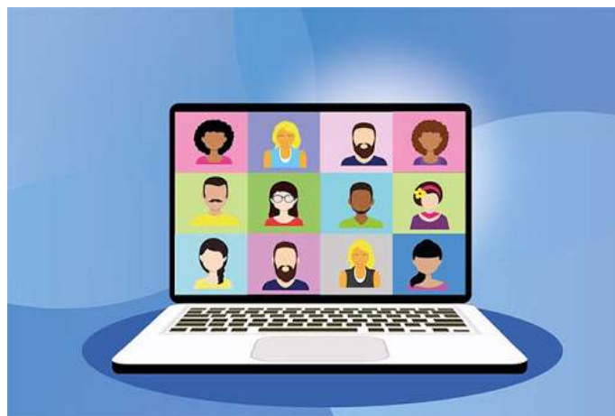
Réunion en visioconférence