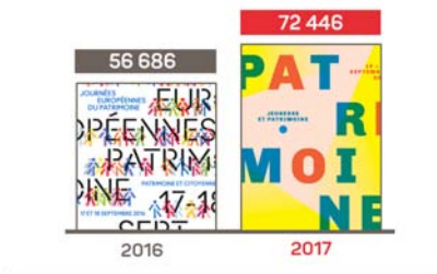
NOMBRE DE VISITEURS POUR LES JOURNÉES EUROPÉENNES DU PATRIMOINE À TOULOUSE

L'objectif sera de développer une image singulière de notre patrimoine qui la fera rayonner au niveau international et irriguera l'ensemble de la métropole.